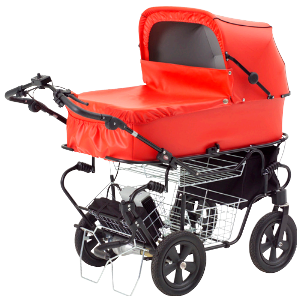
Odder Omega motorvogn